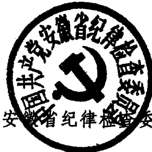
中共安徽省纪律检查委员会